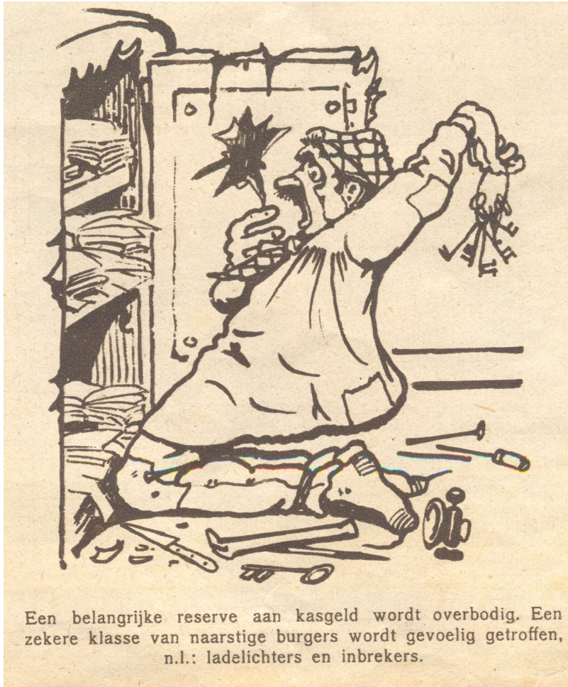
Een belangrijke reserve aan kasgeld wordt overbodig. Een zekere klasse van naastige burgers wordt gevoelig getroffen, n.l.: ladelichters en inbrekers.

formulier het voermiddel worden voor alle mogelijke geldzendingen. Zoals men ziet is ook het girobiljet in drie deelen verdeeld, welke bestemmingen, overeenkomen met die van het stortingsbiljet.